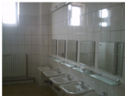
Gradinița Noua—Grup Sanitar

Proiectul în sine a început la sfârșitul anului 2006 iar amplasamentul noii grădinițe se află în curtea spațioasă a Școlii Generale cu clasele I-VIII din comună.