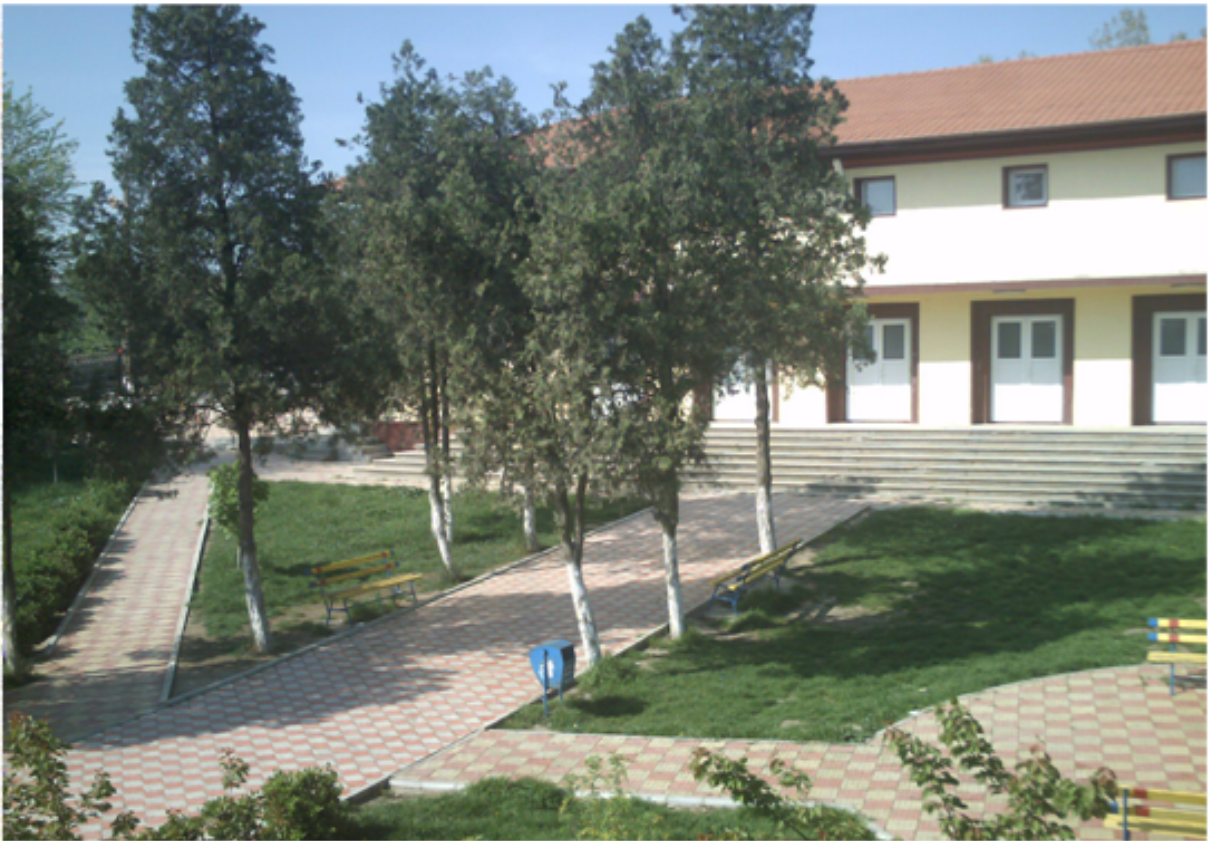
Camionul Cultural din Comuna Lumina si parcul din centrul comunei

In luna martie au inceput lucrarile de amenajare a soselei si construirea de trotuare pe Str. Pelican