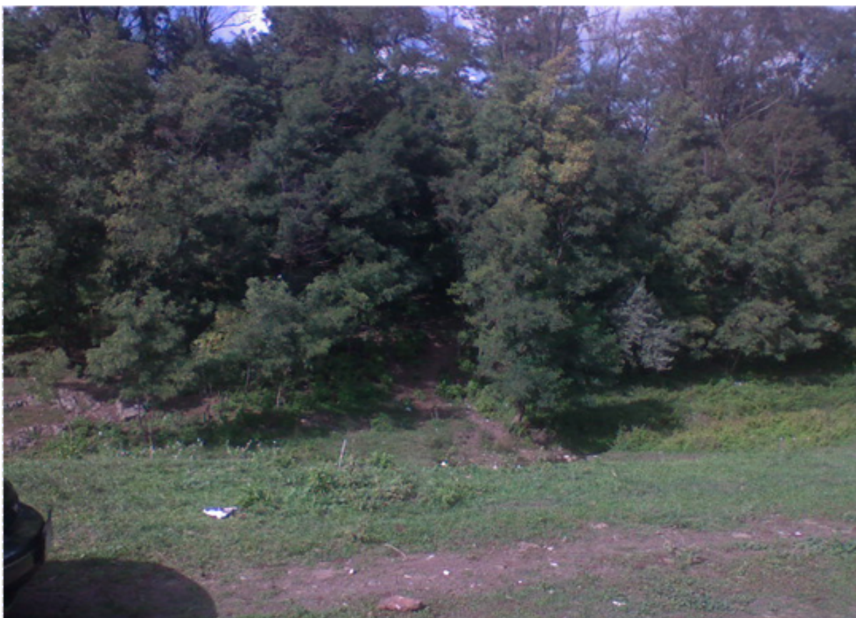
Padurea de la Sibioara