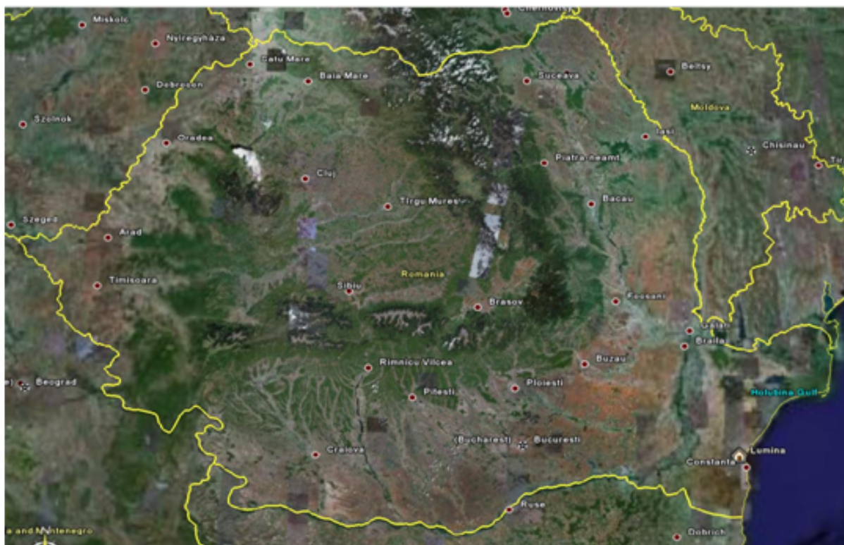
Lumina văzută din satelit