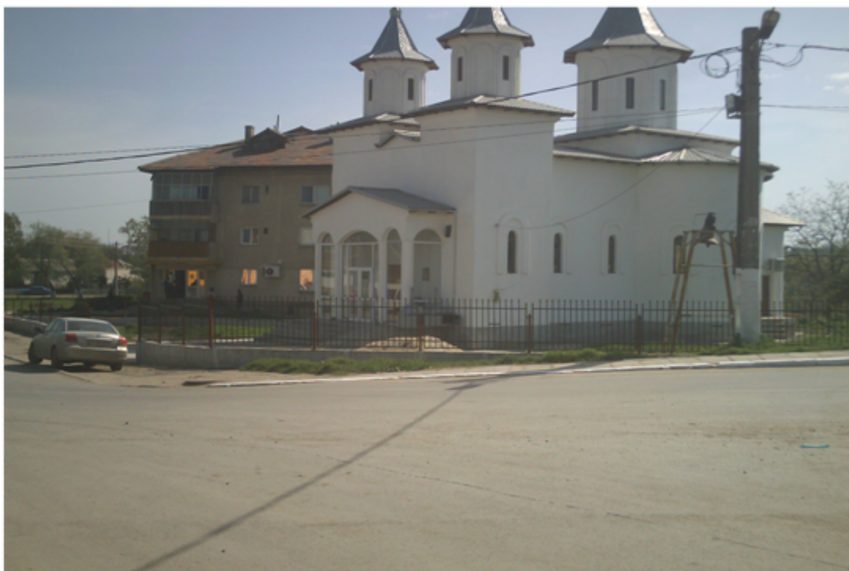
Biserica Parohia 2 din Lumina