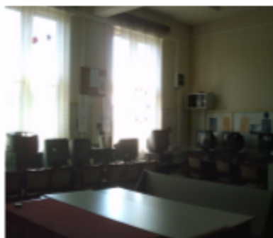
Imagini din școlile din comuna Lumina