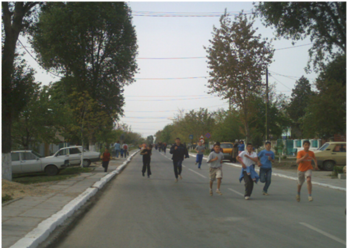
Imagini de la Crosul organizat cu prilejul Zilei Comunei Lumina din 9 mai 2007