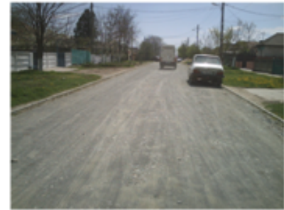
Comuna Lumina—Str. Nărciselor