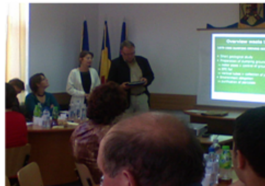
Vizita delegație flamandă, Toamna 2007, Primaria Lumina