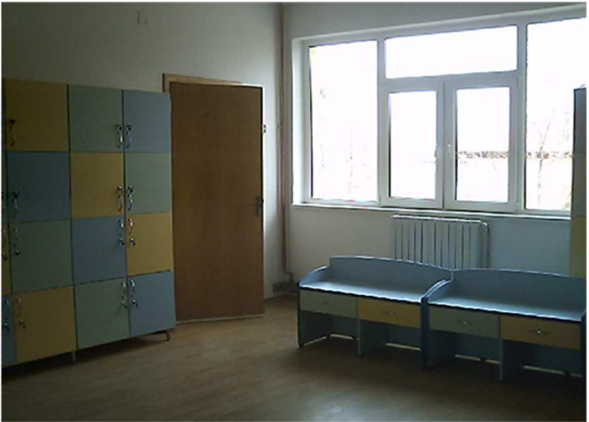
Imagini de la sediul noii gradinite din localitatea Lumina