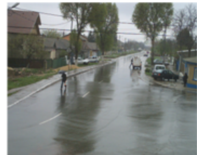
Comuna Lumina—Strada Mare

Un proiect important și de anvergură pentru comuna este introducerea sistemului de alimentare cu gaze. Proiectul a început în anul 2005 prin finanțare de la bugetul local, iar în luna mai 2008, au început lucrările de introducere a sistemului de alimentare cu gaze în Comuna Lumina. Concesionarul acestor lucrări de introducere a sistemului de distribuție a gazelor în comuna, este SC Congaz SA Constanta care a câștigat licitația organizată la București.