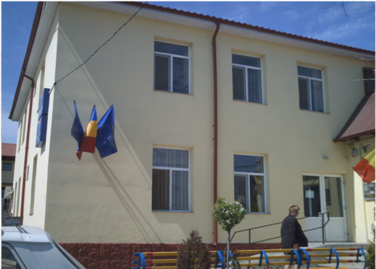
Sediul Primariei si Consiliului Local Lumina