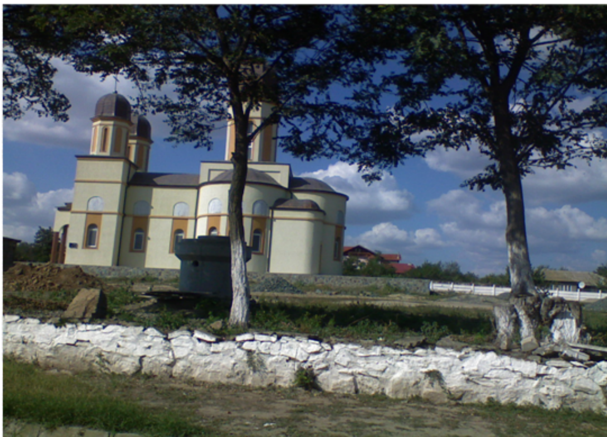
Biserica crestin-ortodoxa din Sibioara