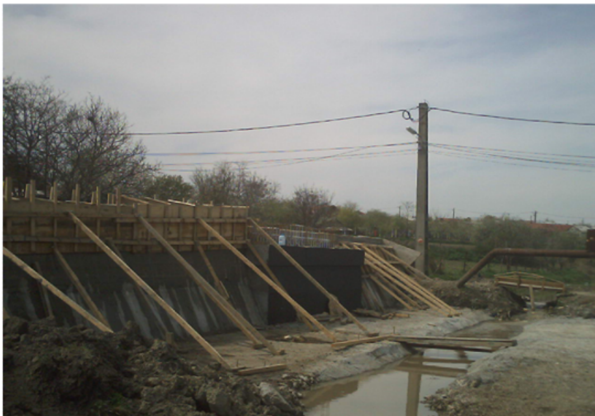
Imagini de la santierul unuia dintre podurile ce vor fi amenajate peste dereaua ce traverseaza valea comunei Lumina. Proiect finantat de Guvernul Romaniei prin "Programul de dezvoltare a infrastructurii din spatiul rural"