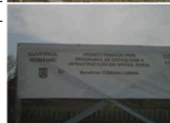
Imagini de pe santierul unuia din podurile ce se construiesc